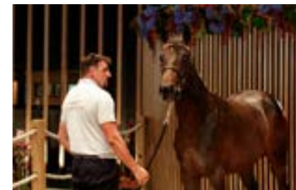
♂ Arqana V.2 Lot 351 vengu €87,000 à Yellow Agency M. ex Sloane De Borepair présenté par le Haras de Castillon