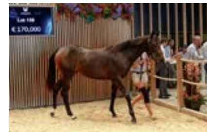
♂ Arqana Août Lot 158 vendue €170,000 au Haras de Meautry F. ex Bianca De Medici présentée par The Channel Consignment