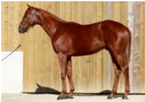
L. Arqana Octobre Lot 430 vendu €52,000 à RPG Bloodstock M. ex Delinda présenté par l'Elevage d'Auge