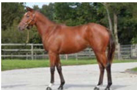
L. Arqana Octobre Lot 488 vendue €42,000 à RPG Bloodstock F. ex Jolie Et Belle présentée par Normandie Breeding