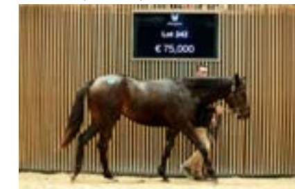
♂ Arqana Octobre Lot 242 vendue €75,000 à Horizon Bloodstock F. ex Persian Belle présentée par le Haras d'Ellon