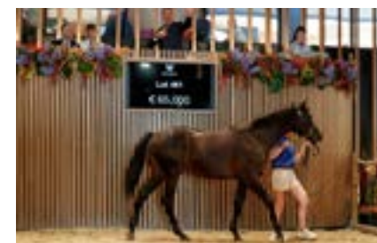
♂ Arqana V.2 Lot 461 vendue €65,000 à SAS Le Marais M. ex Kazeema présenté par le Haras de l'Hotellerie