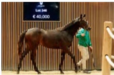
L. Arqana Octobre Lot 346 vendue €40,000 à SAS Le Marais / Fabrice Vermeulen F. ex Visaya présentée par le Haras de Beauvoir